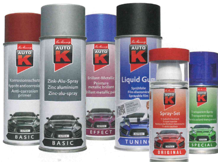
Die Range der Sprühlacke von Auto-K.